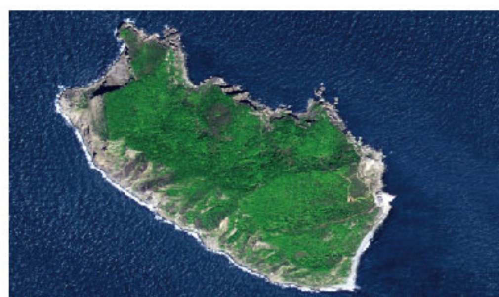
光储柴微网 Micro Grid by Solar PV, BESS and Diesel Generator