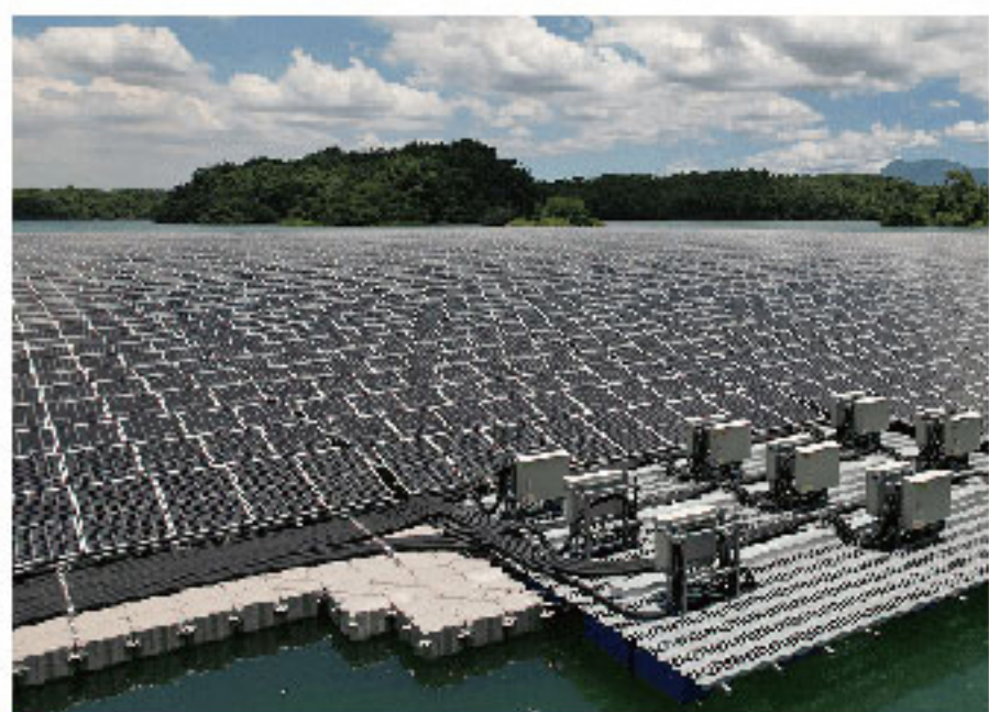
地面光伏电站 Solar PV Power Plant