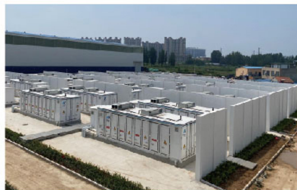
电网侧独立储系统 Power Grid Side BESS