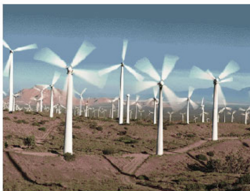
风力发电厂 Wind Power Station