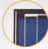
Siyah Profil Black Profile