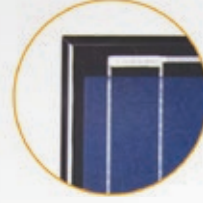
Siyah Profil Black Profile